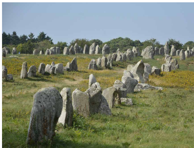
Carnac: 3000 Menhire aus der Prähistorie in Reih und Glied

In der Dunkelheit des Neumonds machen wir uns mitternachts noch einmal auf den Weg an den Strand. Es lockt die Chance, das von Mikroorganismen erzeugte Meeresleuchten hautnah zu erleben. Sicher ist dies nicht, dafür bieten manch andere Tiere des Strandes genug Aufregendes.