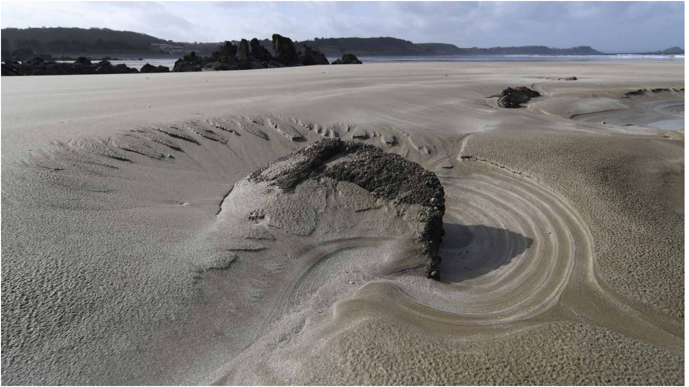
Bald tosen hier wieder meterhohe Wellen. Gezeiten sind eine gigantische Herausforderung für jedes Lebewesen.

Kormorane, Mantel- und Silbermöwen und Eissturmvögel hautnah. Der weithin sichtbare Leuchtturm aus den 1940-er Jahren ist im Sommer begehbar.