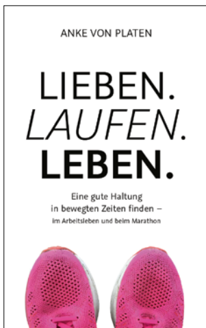
Anke von Platen: Lieben. Laufen. Leben. Books on Demand, 2020, 15,00 Euro